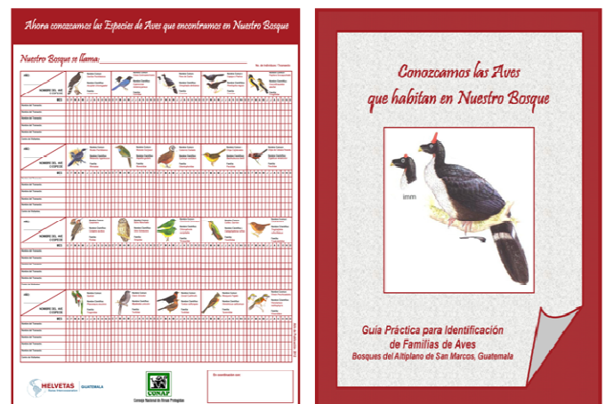
Herramientas para Monitoreo Biológico: Papelógrafo y Guía para Identificación de Familias de Aves

Los altos índices de pobreza y la falta de alternativas de desarrollo aumentan la presión sobre los bosques, además otras amenazas como la ocurrencia de incendios forestales y plagas forestales. En los años recientes, la gobernabilidad de la zona está siendo afectada debido al surgimiento de conflictos derivados de actividades mineras, hidroeléctricas y negocios ilícitos.