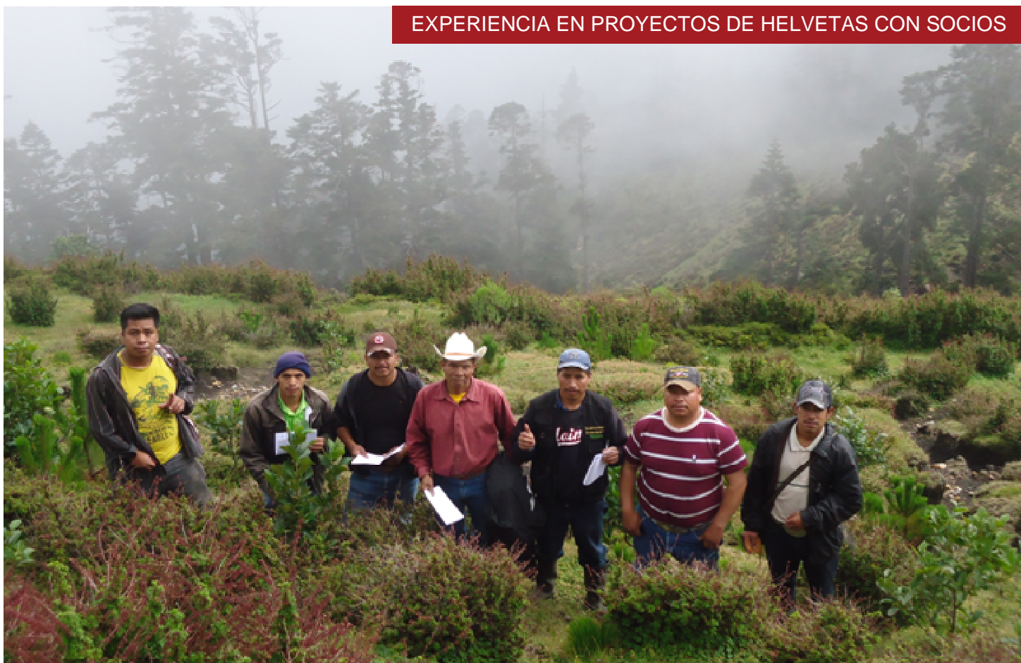
Arriba: Bosque Comunal Toninchun en Tajumulco, Departamento de San Marcos